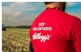
Presentado por DINEROENIMAGEN

Estas chamarras con materiales reciclados te mantendrán calentita todo el invierno