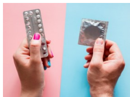
Presentado por SALUD180

De enfrentar retos a salir fortalecidos: dos perspectivas de éxito empresarial