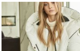
Presentado por ACTITUDFEM

Estas chamarras con materiales reciclados te mantendrán calentita todo el invierno