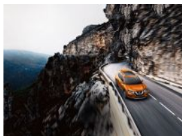
Presentado por ACTITUDFEM

¿Las infecciones vaginales causan cáncer?