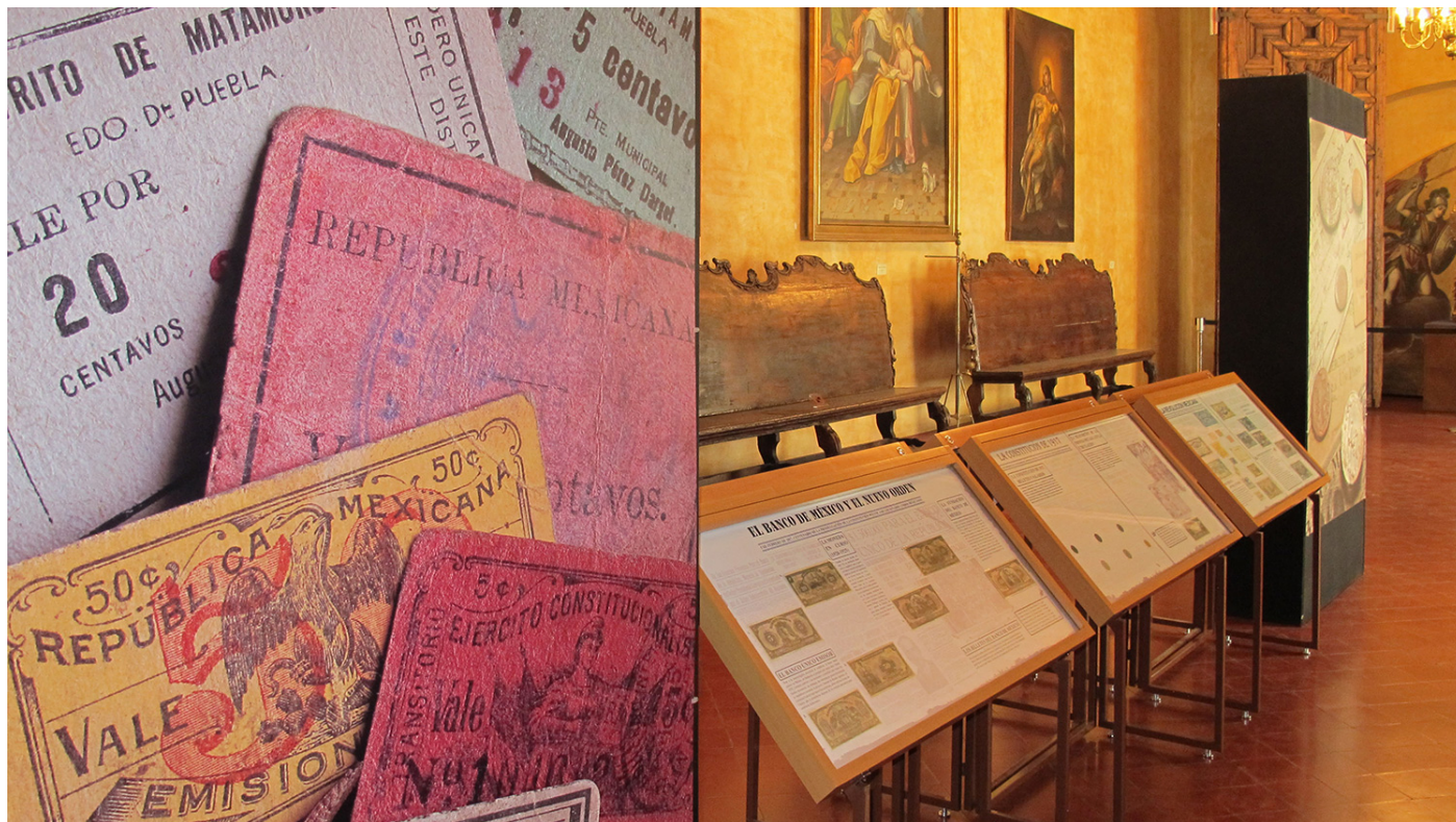
La colección procede de la Colección Numismática del Banco de México.

📧 ( whatsapp://send?text=https://inah.gov.mx/boletines/5899-exposicion-muestra-el-impacto-de-la-constitucion-de-1917-en-la-circulacion-monetaria )